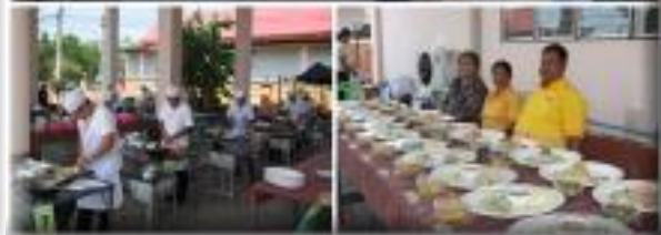
รูป การทดสอบมาตรฐานฝีมือแรงงาน ในสาขาอาชีพ ต่างๆ