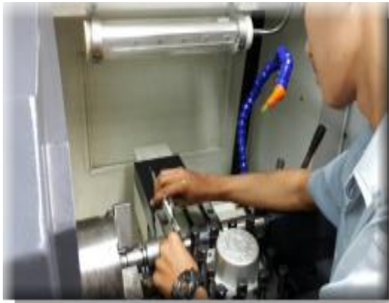
รูป สาขาอาชีพ เตรียมเข้าทำงาน

(2).การฝึกอบรมเพื่อเตรียมเข้าทำงาน เป็นการฝึกอบรมตามหลักสูตรที่กรมพัฒนาฝีมือแรงงานจัดทำไว้ เพื่อเตรียมตัวเข้าทำงานในภาคอุตสาหกรรมและภาคต่างๆ ที่ขับเคลื่อนเศรษฐกิจของประเทศ เพื่อให้เข้าสู่ระดับโลกในอนาคต สาขาที่เปิดฝึกอบรม เช่น ช่างกลึง ช่างซ่อมจักรยานยนต์ ช่างเชื่อม ช่างซ่อมไมโครคอมพิวเตอร์ เป็นต้น