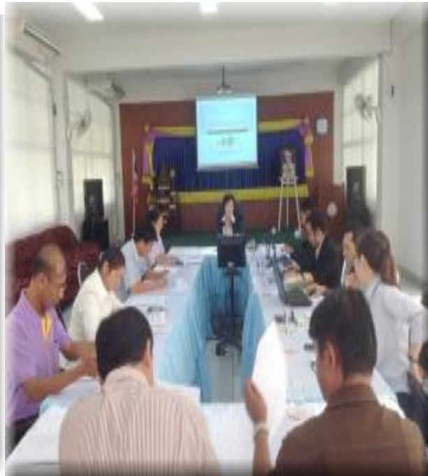
รูปกิจกรรม การประชุมสัมมนา ต่างๆ