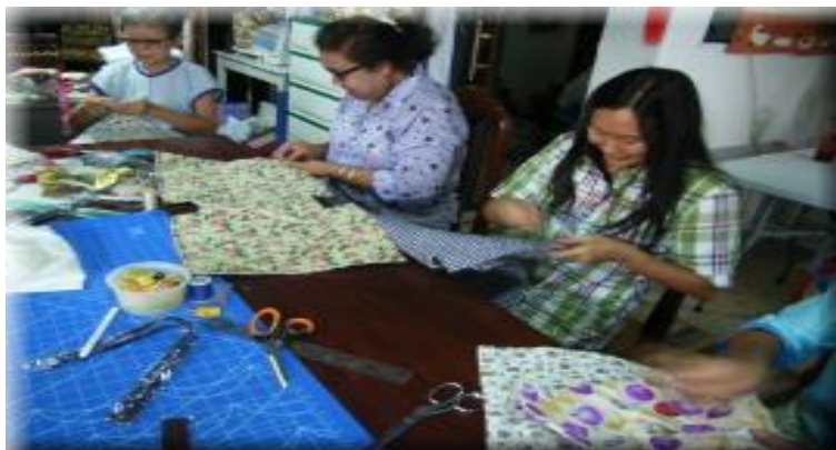
รูปกิจกรรมการฝึกอาชีพเสริม